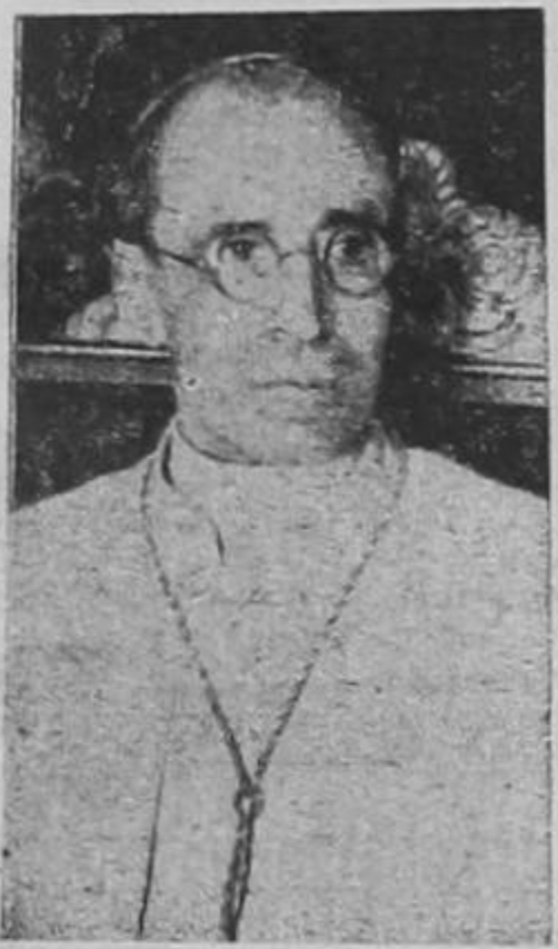
SU SANTIDAD PIO XII